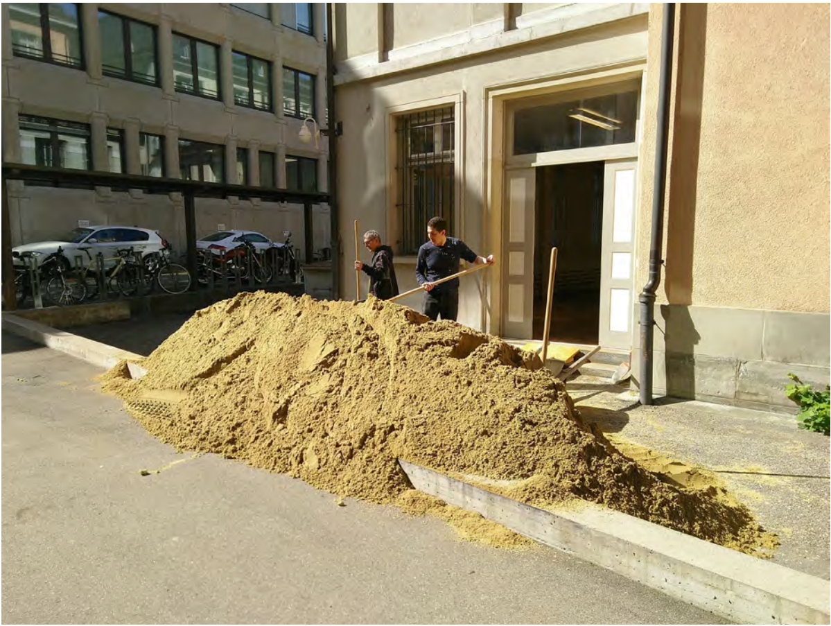
Aufbau der Ausstellung S01E02 Unfreeze von Urs August Steiner